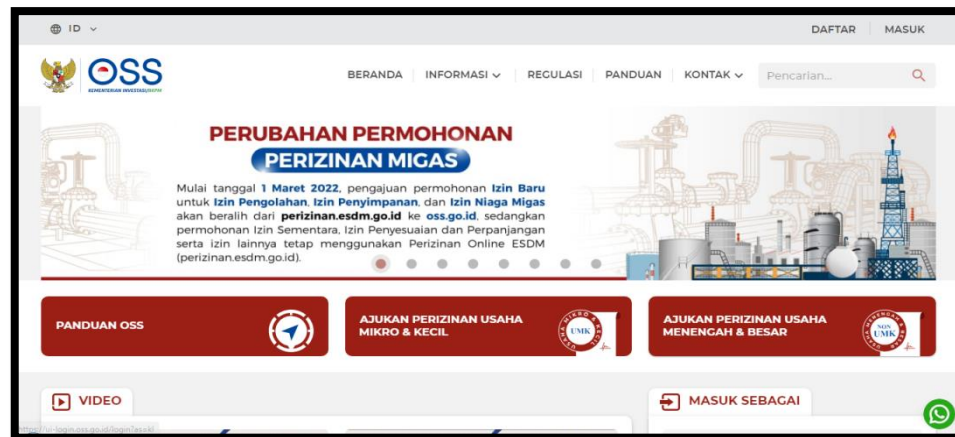
Gambar 1. Website (DPMPTSP) https://oss.go.id/