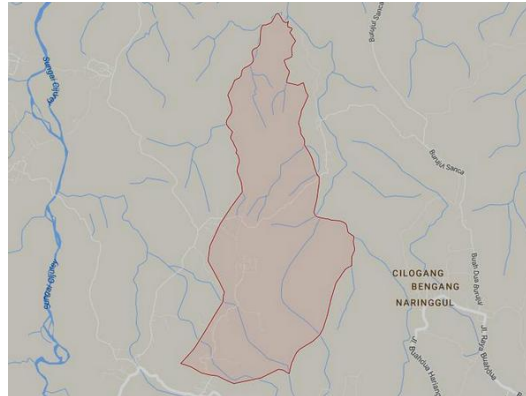
Gambar 1. Peta wilayah Desa Citaleus