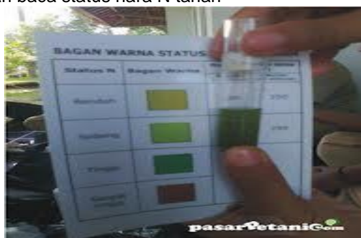
Gambar 3. Penetapan Status N tanah