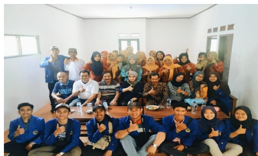
Gambar 2. Kegiatan Pengabdian Masyarakat Di Desa Citaleus