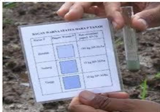
Gambar 4. penetapan P tanah