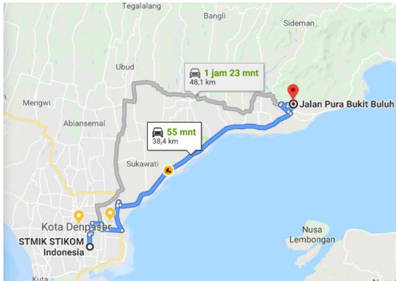
Gambar 1. Maps Lokasi