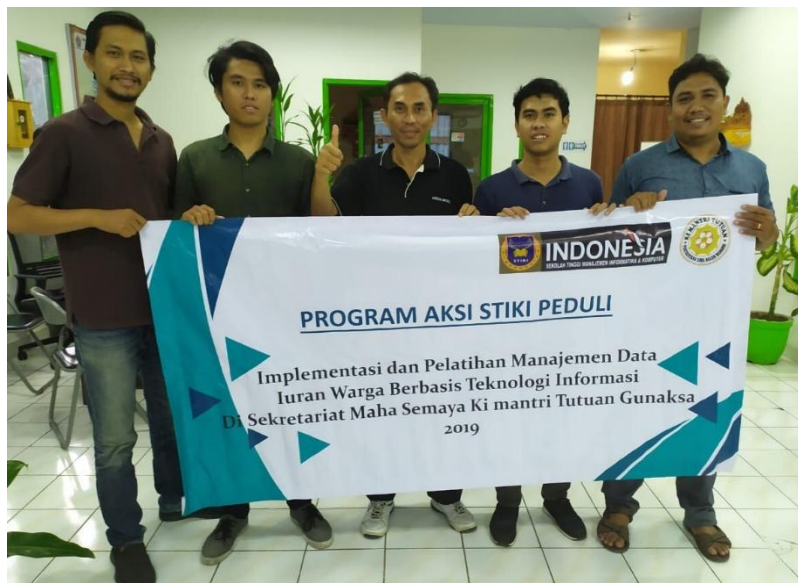
Gambar 2. Sekretariat Warga Ki Mantri Tutuan Gunaksa