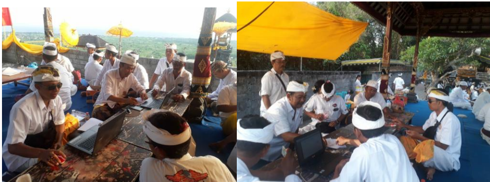
Gambar 3. Hasil Kegiatan Sosialisasi, Pelatihan, dan Pendampingan Sistem Informasi dan Aplikasi Mobile