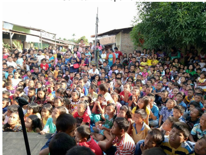
Gambar 2. Kondisi Lokasi