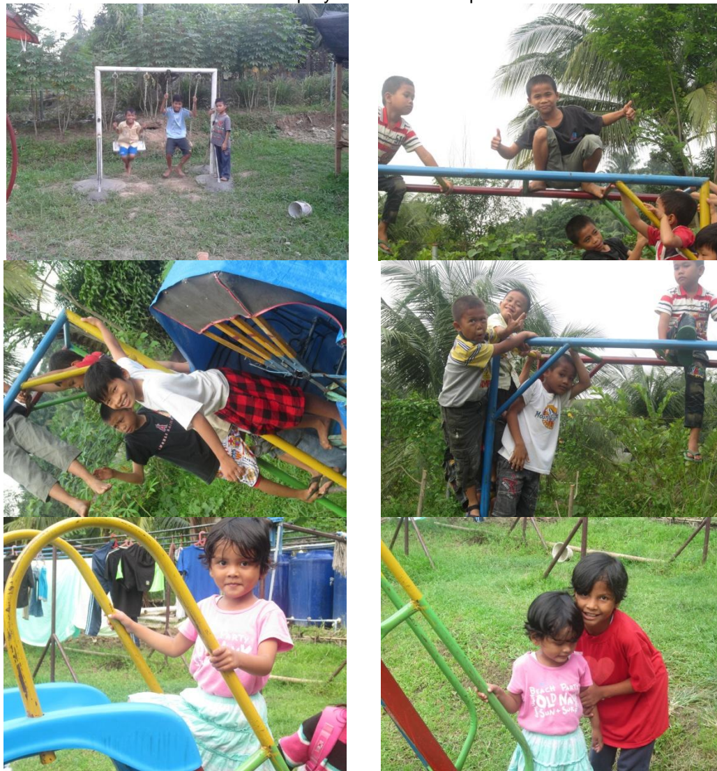
Gambar 3. Profil Kegiatan Penghuni panti

Hari ini kita terus mendukung anak-anak yang menjadi korban bencana alam, kemiskinan, penganiayaan dan penganiayaan agama. Kami telah menanam empat proyek di Aceh dan juga rumah anak-anak di Deli Tua dan sebuah proyek sekolah di Papua Indonesia.