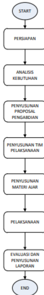
Gambar 2. Tahapan Pelaksanaan Pengabdian Masyarakat.

SMP Muhammadiyah 16 Serdang Bedagai, sebagai media untuk menyebarkan informasi baik kepada guru dan siswanya maupun untuk calon siswa.