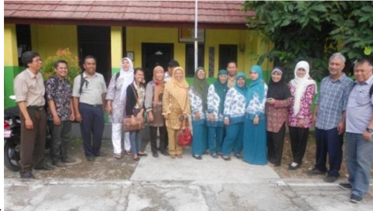
Gambar 6. Gambar-gambar SMP Muhammadiyah 16 Serdang Bedagai