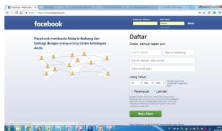
Gambar 3. Halaman Utama

Para guru sangat antusias mengikuti pelatihan ini dan bahkan beberapa meminta untuk penambahan waktu pelatihan. Evaluasi selama pelatihan adalah guru-guru dan siswa mendapatkan tambahan pengetahuan baru, yang berkaitan dengan pemanfaatannya, meskipun media sosial seperti facebook sudah cukup familiar bagi mereka, namun belum dimanfaatkan secara optimal bagi pengembangan SMP Muhammadiyah 16 Serdang Bedagai. Hal ini dikarena belum adanya akses internet di lingkungan SMP Muhammadiyah 16 Serdang Bedagai, padahal kebutuhan akses inernet menjadi kebutuhan utama ketika ingin memanfaatkan media sosial.