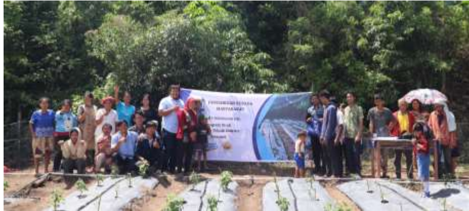
Gambar 2: tim dan peserta pelatihan

Implementasi sistem irigasi tetes bertenaga surya yang dilengkapi dengan teknologi LoRa memungkinkan pemantauan dan kontrol jarak jauh secara real-time. Hal ini selaras dengan penelitian sebelumnya yang menunjukkan bahwa teknologi ini dapat meningkatkan efisiensi air dan mengurangi beban kerja petani di desa Banua Huta (Arianti et al., 2023). Dengan pemantauan dan kontrol jarak jauh, petani dapat mengoptimalkan penggunaan air sesuai dengan kebutuhan tanaman, yang berdampak positif pada produktivitas panen. Diagram alir sistem irigasi tetes bertenaga surya di desa Banua Huta diberikan pada Gambar 3.