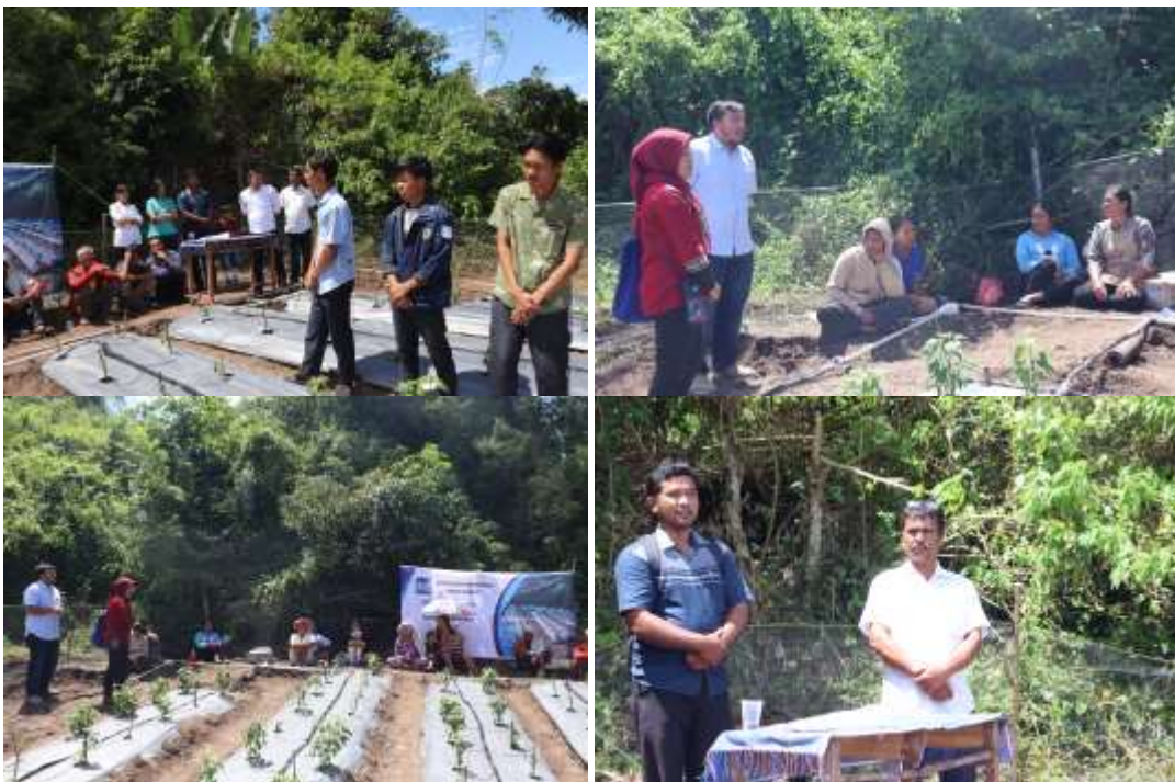
Gambar 1: tim memberikan materi dalam pelatihan

Selain itu, evaluasi penggunaan website untuk pemantauan dan kontrol sistem irigasi menunjukkan tingkat kepuasan yang tinggi. Hal ini penting karena penggunaan teknologi digital dalam pengelolaan irigasi dapat membantu petani dalam meningkatkan efisiensi penggunaan air dan produktivitas panen. Gambar 1 dan Gambar 2 menunjukkan proses pelatihan yang dilakukan oleh tim.