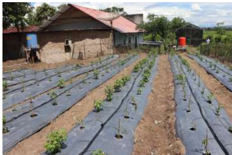
Gambar 4: implementasi sistem irigasi di desa Banua Huta