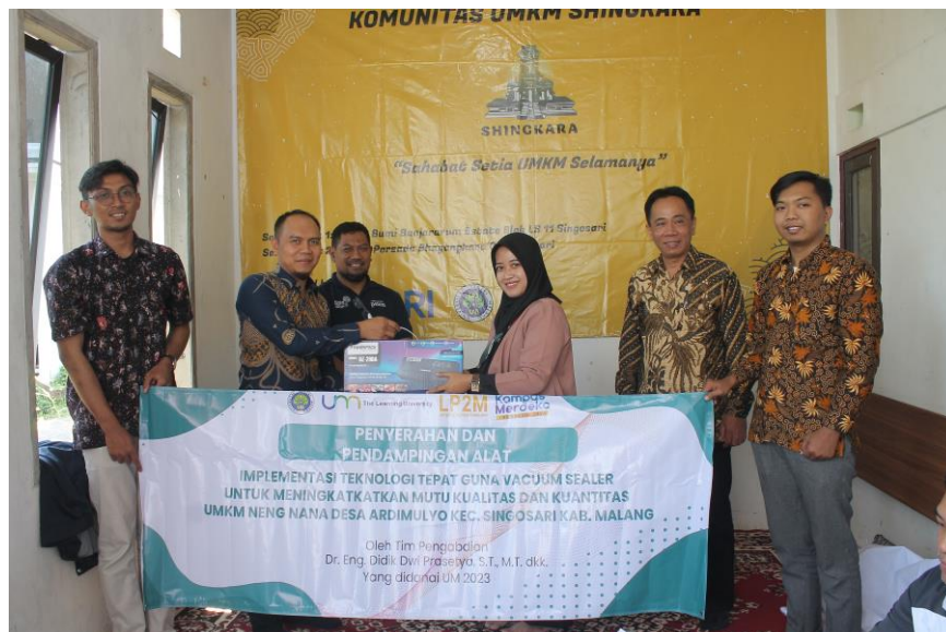
Gambar 4. Penyerahan Alat Vacuum Sealer

Dengan adanya kegiatan pengabdian masyarakat ini dapat meningkatkan beberapa aspek yaitu diantaranya: