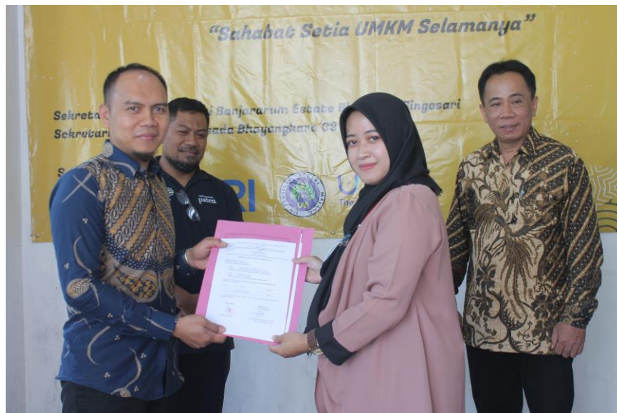
Gambar 4. Penyerahan Berkas Serah Terima Alat