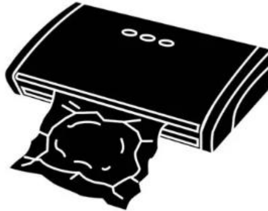
Gambar 4. Vacuum Sealer

memudahkan dalam penyimpanan makanan di freezer.