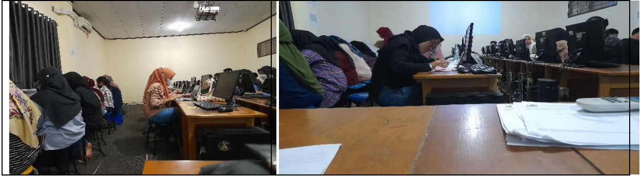
Gambar 3. Mahasiswa Mengerjakan Turunan Dengan Komputasi Matlab

Sebagai bahan evaluasi untuk mahasiswa yaitu dengan memberi tugas kerja mandiri kepada mahasiswa melakukan proses komputasi dan menginterpretasikan hasilnya. Selama proses kerja mandiri tersebut, mahasiswa senantiasa dapat berkonsultasi kepada tim dosen jika ada masalah dan hal-hal yang belum diketahui mengenai komputasi Matlab pada materi turunan. Hasil yang diperoleh dari pengerjaan tugas kerja mandiri, mahasiswa sudah dapat menyelesaikan soal-soal turunan secara komputasi. Faktor yang menghambat dalam proses kegiatan ini diantaranya adalah ada beberapa komputer yang tidak support dalam Matlab yang diinstallkan.