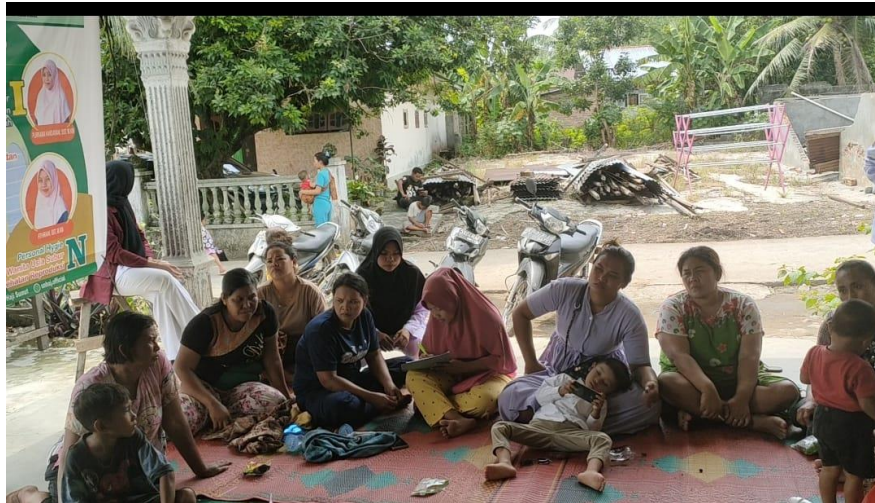
Gambar 1. Survei pendahuluan tentang topik pengabdian masyarakat

Pengetahuan wanita usia subur di Lingkungan V Kelurahan Tanah Merah Kecamatan Binjai Selatan Kota Binjai Prov. Sumatera Utara yang berpengetahuan cukup sebanyak 35 orang dimana hasil ini menunjukkan bahwa minimal ada yang sudah terpapar informasi tentang SADARI namun mereka belum begitu paham dalam pelaksanaannya sehingga mereka tidak melakukan SADARI. Pekerjaan juga dapat mempengaruhi pengetahuan dimana pekerjaan pada pengabdian masyarakat ini sebagian besar juga bekerja sebagai IRT (Ibu Rumah Tangga). Pekerjaan IRT ini hanya mempunyai kegiatan yang berfokus mengerjakan pekerjaan rumah, oleh karena itu tidak mendapatkan pengalaman pengetahuan di lingkungan kerja. Ibu yang tidak bekerja akan lebih susah menerima dan mencari informasi sehingga akan kurang terpapar dengan informasi kesehatan dan berpengaruh terhadap pola pikirnya. Bagi ibu-ibu yang bekerja akan mempunyai pengaruh terhadap kehidupan sehari-hari baik itu dalam keluarga, pemeliharaan kesehatan, status sosial ekonomi, ketepapanan informasi, dan gaya hidup seseorang. Ibu yang bekerja akan lebih banyak berinteraksi dengan orang-orang di lingkungan kerjanya sehingga akan saling bertukar pikiran dan pendapat (Mayssara, Hassanin, 2019).