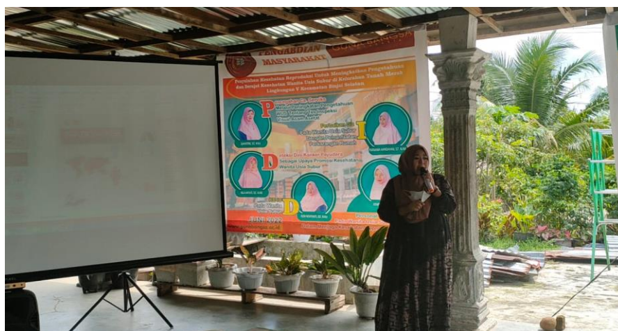
Gambar 2. Penjelasan Tentang Kanker Payudara dan SADARI

Pengetahuan wanita usia subur di Lingkungan V Kelurahan Tanah Merah Kecamatan Binjai Selatan Kota Binjai Prov. Sumatera Utara yang berpengetahuan cukup sebanyak 35 orang dimana hasil ini menunjukkan bahwa minimal ada yang sudah terpapar informasi tentang SADARI namun mereka belum begitu paham dalam pelaksanaannya sehingga mereka tidak melakukan SADARI. Pekerjaan juga dapat mempengaruhi pengetahuan dimana pekerjaan pada pengabdian masyarakat ini sebagian besar juga bekerja sebagai IRT (Ibu Rumah Tangga). Pekerjaan IRT ini hanya mempunyai kegiatan yang berfokus mengerjakan pekerjaan rumah, oleh karena itu tidak mendapatkan pengalaman pengetahuan di lingkungan kerja. Ibu yang tidak bekerja akan lebih susah menerima dan mencari informasi sehingga akan kurang terpapar dengan informasi kesehatan dan berpengaruh terhadap pola pikirnya. Bagi ibu-ibu yang bekerja akan mempunyai pengaruh terhadap kehidupan sehari-hari baik itu dalam keluarga, pemeliharaan kesehatan, status sosial ekonomi, ketepapanan informasi, dan gaya hidup seseorang. Ibu yang bekerja akan lebih banyak berinteraksi dengan orang-orang di lingkungan kerjanya sehingga akan saling bertukar pikiran dan pendapat (Mayssara, Hassanin, 2019).