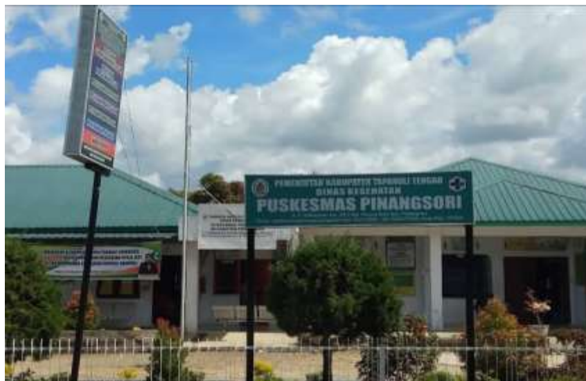
Gambar 3: Lokasi Pengabdian

Lokasi tempat penyuluhan di lakukan di Puskesmas Pinang Sori yang berada di Jalan Padang Sidempuan Km 29,5 Kecamatan Pinang Sori, Kabupaten Tapanuli Tengah, Sumatera Utara