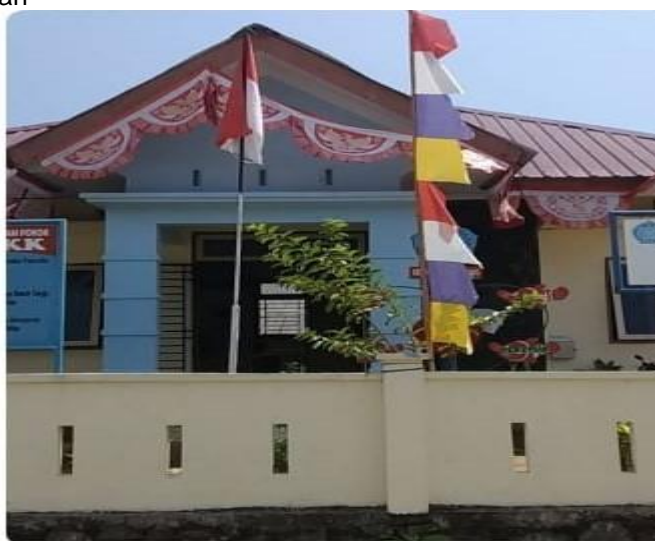
Gambar 2. Tempat Kegiatan