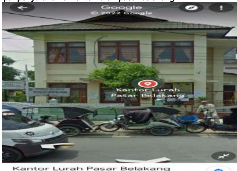
Gambar 2 Lokasi kantor kelurahan Pasar belakang tempat di laksanakannya pengabdian masyarakat