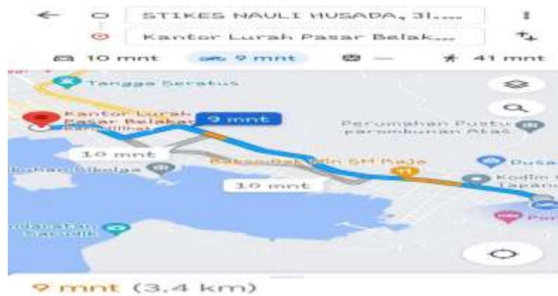
Gambar 1 Tempat Pengabdian

Lokasi Kegiatan Pengabdian Masyarakat ini di laksanakan di Kelurahan Pasar Belakang tepatnya di kantor lurah pasar belakang yang teletak di sibolga kota, Sibolga, Sumatera Utara, Indonesia. Jarak perguruan tinggi ke kantor lurah pasar belakang dapat di tempuh selama 9 menit.