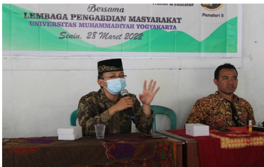
Gambar 6. Peserta sosialisasi sedang menerima informasi dari narasumber