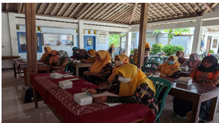
Gambar 4. Peserta sosialisasi mengenai game online