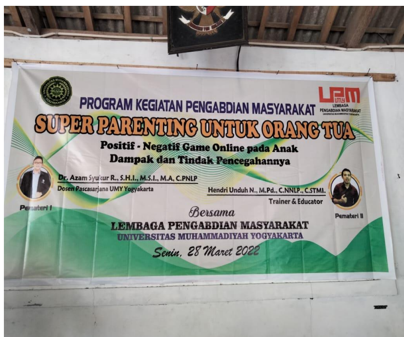
Gambar 1. Backdrop sosialisasi mengenai game online

Berikut merupakan dokumentasi mengenai dampak dari game online di desa kalisemo, Kecamatan Loano, Kabupaten Purworejo :