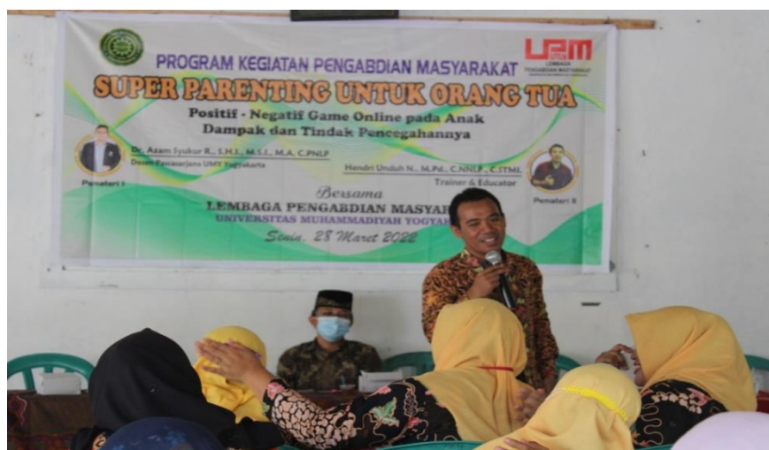
Gambar 8. Kegiatan diskusi mengenai dampak game online

Format diskusi cukup sederhana yaitu ketika narasumber sudah selesai menyampaikan materi, pembawa acara akan mempersilahkan kepada peserta (dalam hal ini orang tua) untuk mengangkat tangan ketika ingin bertanya. Berikut adalah dokumentasi dari kegiatan forum diskusi :