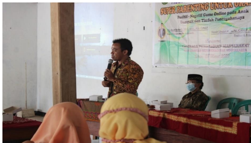
Gambar 3. Peserta sosialisasi mengenai game online