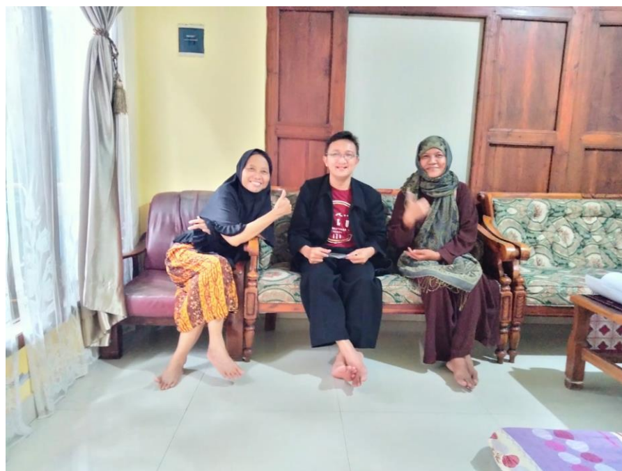
Gambar 10. Konseling dengan warga desa kalisemo

Selain diadakan forum diskusi dan tanya jawab, diadakan pula sesi konsultasi secara pribadi dengan nara sumber yang disebut sebagai konseling. Komunikasi secara pribadi dari hati ke hati dapat meningkatkan hasil yang lebih baik. Berikut merupakan dokumentasi dari sesi konseling yang sudah dilakukan di desa kalisemo :