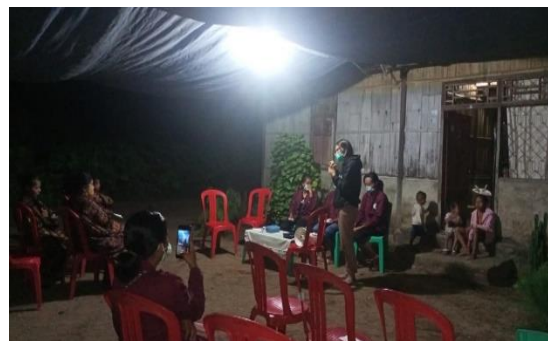
Gambar 3 Kegiatan Pemicuan