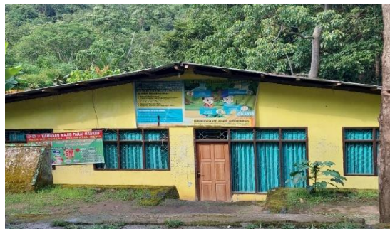
Gambar 2. Kantor Desa Wolodhesa (Lokasi kegiatan Pemicuan Stop BABS)