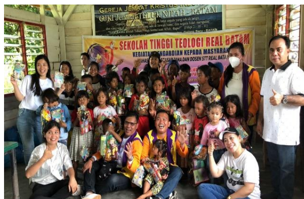
Gambar 2. Lokasi Pengabdian