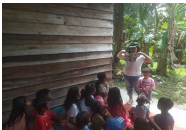
Gambar 4. Foto Tim saat menunjukkan gambar kepada anak-anak

Media merupakan salah satu cara dalam menyampaikan pendidikan agama Kristen pada anak. Kadangkala saat kita hendak menyampaikan pengajaran maka kita perlu memperhatikan media apa yang akan kita gunakan. Dalam ulangan 6:4-9 bangsa Israel mengajarkan firman Tuhan dengan menggunakan media yaitu tiang pintu dan gerbang serta tangan. 7 Tim menggunakan media gambar untuk memperlihatkan kepada anak tentang apa yang sedang dipelajari sehingga anak-anak terlatih untuk berfikir tentang apa yang sedang dilihatnya. Gambar yang digunakan dalam pelajaran ini adalah memperkenalkan para tokoh-tokoh yang ada dalam Alkitab, karena selama ini anak-anak hanya mendengar cerita saja tanpa mengenal gambar. Gambar ini membantu anak untuk mengingat apa yang sudah dipelajarinya.