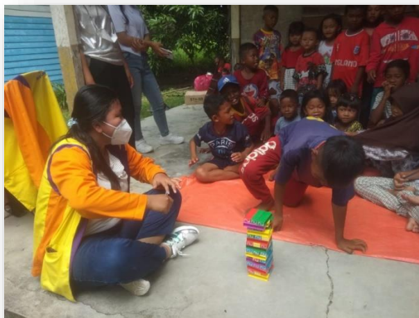
Gambar 5. Foto anak-anak sedang bermain bersama dengan tim

anak-anak dapat bereksresi, sehingga anak-anak dapat belajar tentang benda-benda dan orang lain. 8