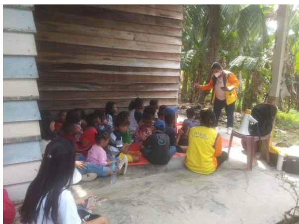
Gambar 3. Foto Tim saat menceritakan tentang tokoh Alkitab