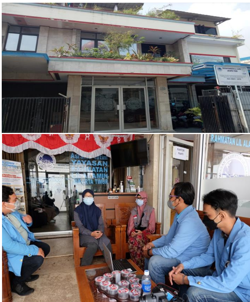
Gambar 1. Lokasi Pengabdian