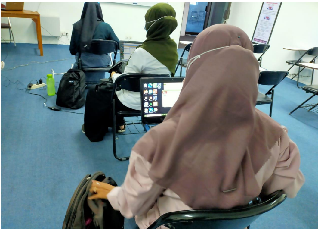
Gambar 3. Mahasiswa Mendengar Ceramah