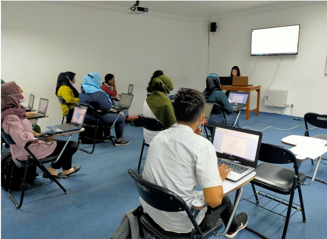
Gambar 2. Lokasi Pengabdian