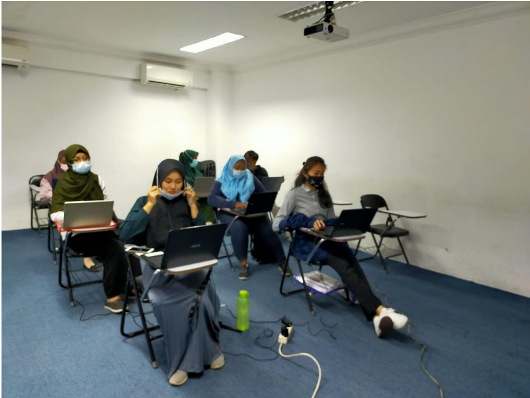
Gambar 4. Mahasiswa Mendengar Ceramah