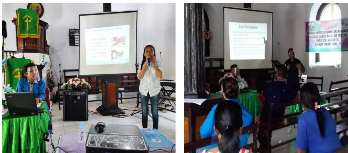
Gambar 3. Gambaran Kegiatan Pengabdian