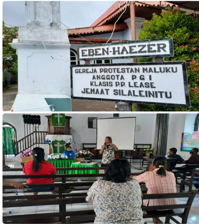
Gambar 2. Lokasi Pengabdian