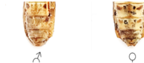
Gambar 1. Bentuk abdomen walang sangit jantan (♂) dan betina (♀)

Hasil pengujian ketertarikan walang sangit jantan dan betina terhadap empat jenis perangkap yang berbeda disajikan pada Tabel 1.