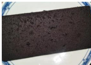
Gambar 2. Brownies kukus substitusi bekatul beras merah

produk serta sebagai daya tarik pada produk. Tampilan brownies setelah proses pengukusan dapat dilihat pada Gambar 2.